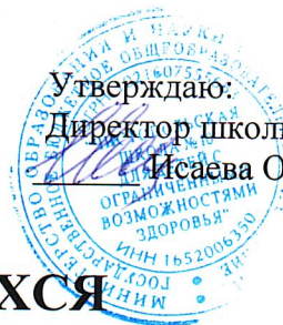
ГРАФИК ПИТАНИЯ УЧАЩИХСЯ В СТОЛОВОЙ НА 2024-2025 учебный год.